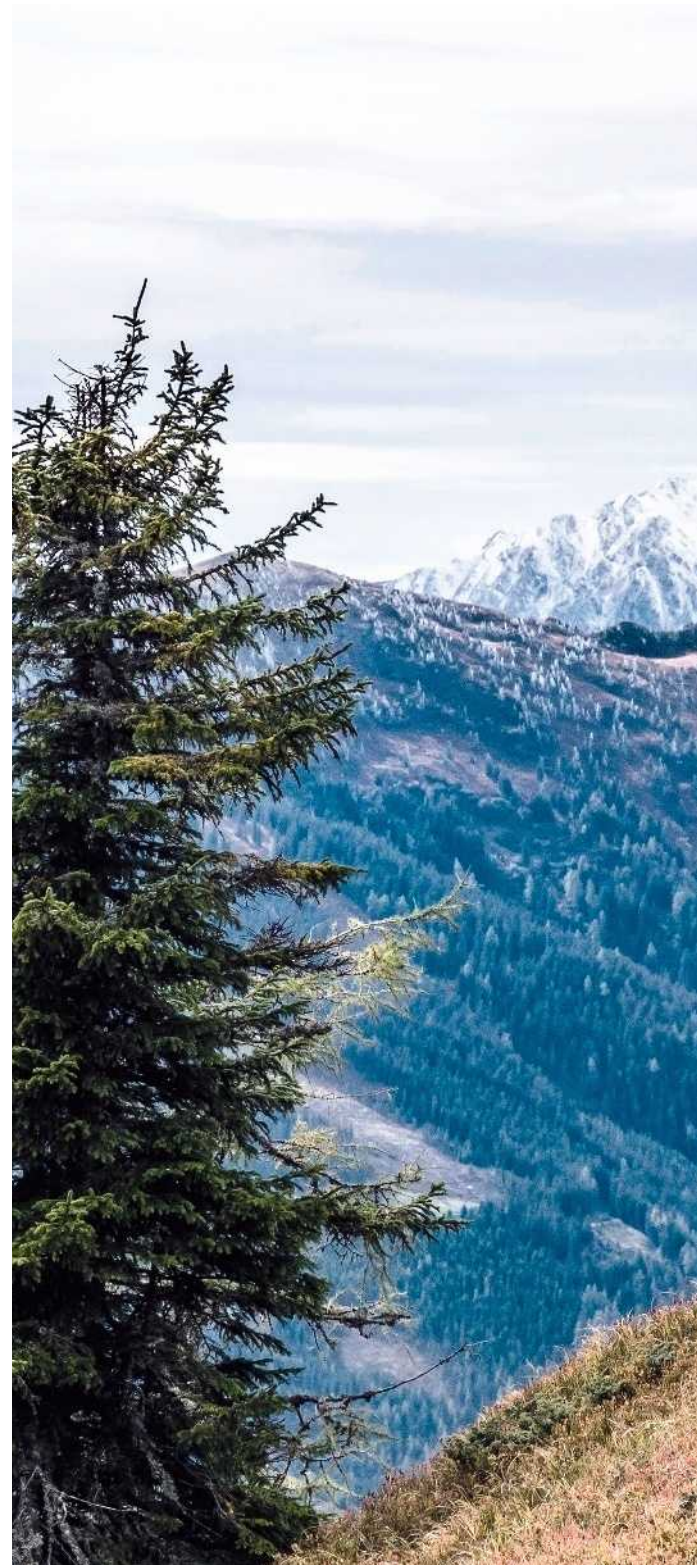
En chemin vers Johnsbach, sur les crêtes couvertes d'un véritable tapis persan de mousses moirées.